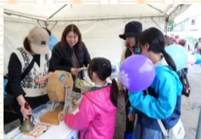
文字探しラリーガラポン抽選会