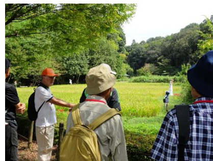
長屋門前の田んぼ

昨年に続き、郷土座間についての学習研究や市民へのガイドを行っている団体が講師となり全2回の講座を開催しました。