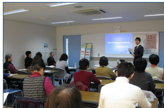
熱心にメモをとる参加者