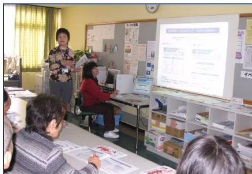
パソコン画面を使っでの説明

12月12日(土)情報サイト「ざまっと」登録・操作説明会を開催しました。今回は、実際のパソコン画面や操作を間近で見、より入力方法を理解していただくことを目的に、サポートセンター内で行いました。少し窮屈さはありませんでしたが、説明者と参加者との距離感がなく、アットホームな形で、質疑応答ができました。