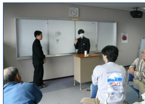
おもちゃドクターとの相談会

個人参加のチームの相談にのっていただきました相模原・座間のおもちゃドクターの会の有志の方、ご協力ありがとうございました。